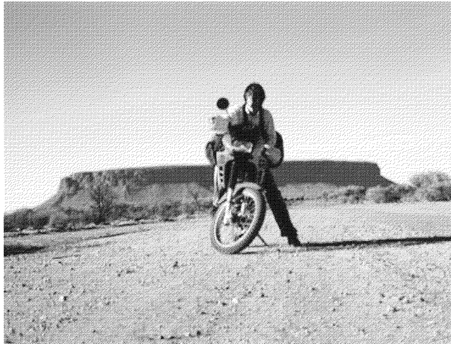
バイクで砂漠をひた走る筆者

ら走り続けた。セ氏四〇度近い灼熱の日が続く。人に出会うことはほとんどない。どこを見回しても真平らな大地にただ一人立つと、世界の大部分が空であることに気づかされる。大地は少年時代に経験した、あの自由で危険な感覚がよみがえってくる。中学・高校・大学と人並みに「世間」とつきあわざるをえなかった僕には、こうした開かれた場所に身を置きなおすことが絶対に必要だった。そして、これは僕に限らないのではな